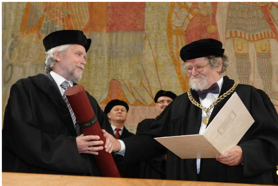
Obr. 1. Prof. Endre Szemerédi (vlevo) přebírá čestný doktorát v aule Univerzity Karlovy od prof. Jaroslava Nešetřila (vpravo).

součet tří prvočísel (viz [18]). Navíc nedávno Terence Tao dokázal, že každé liché číslo větší než jedna je součtem nejvýše pěti prvočísel [17].