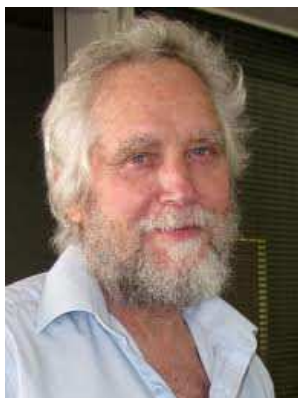
ENDRE SZEMERÉDI

V letošním roce putuje Abelova cena za matematiku do Maďarska k prof. Endre Szemerédimu, který ji dostal za své fundamentální objevy v diskrétní matematice a teoretické informatice a jejich dlouhotrvajícím vlivům na aditivní teorii čísel a ergodickou teorii [20]. Je to již desátá jubilejní Abelova cena od svého vzniku v roce 2003. Dalším maďarským matematikem, který tuto nejprestižnější cenu za matematiku získal v roce 2005, je Peter Lax. Matematika v Maďarsku má totiž dlouholetou tradici. Vzpomeňme několika dalších významných maďarských matematiků světového významu, např. János Bolyai, Lipót Fejér, Marcel Grossmann, Alfréd Haar, András Hajnal, Cornelius Lanczos, László Lovász, John von Neumann, Rózsa Péter, George Pólya, Alfréd Rényi, Marcel Riesz, Pál Turán a jeho manželka Vera T. Sós, Endre Süli, Karl Zsigmondy, a též Pál Erdős, který má v databázi Mathematical Reviews registrováno přes 1 500 vědeckých prací. Jen málo zemí velikosti Maďarska se může podobným seznamem pochlubit.