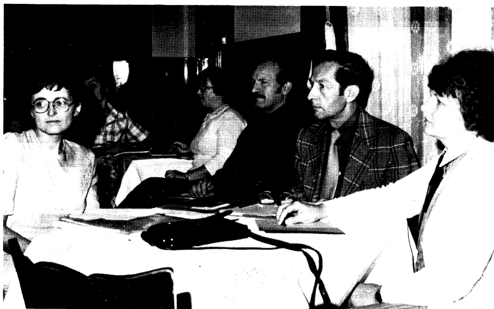
Z pléna konference