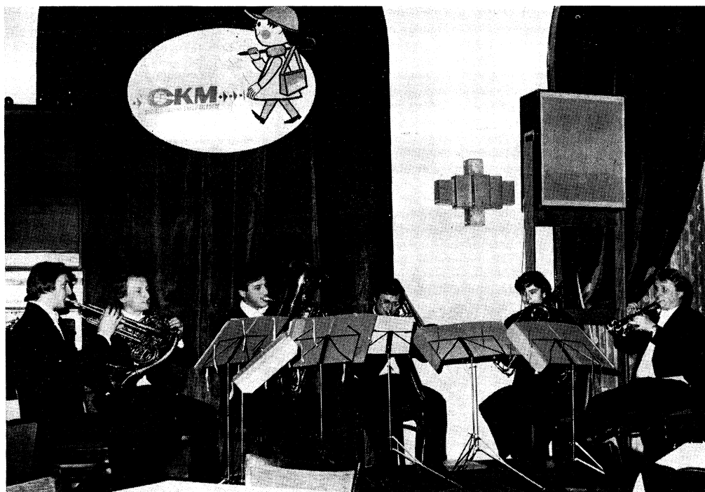
Pražský komorní žestový soubor