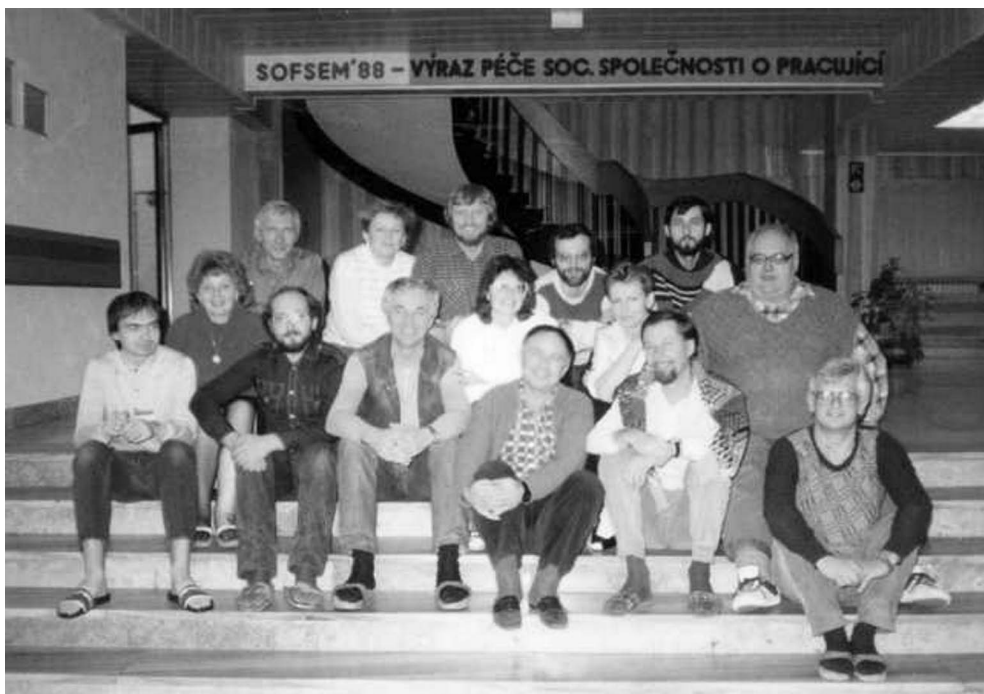
Obr. 1. Několik účastníků SOFSEMu 88 (Magura).