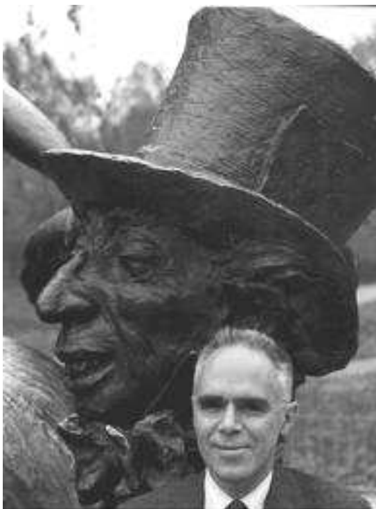
Obr. 5. Martin Gardner a Alenka v říši divů

k Alence nic nového, jen jsem se díval do literatury a vše sepsal do poznámek pod čarou. Byl to dobrý nápad, protože je to má nejprodávanější kniha.“ Později vyšla ještě v několika dalších vydáních a byla přeložena do mnoha světových jazyků.