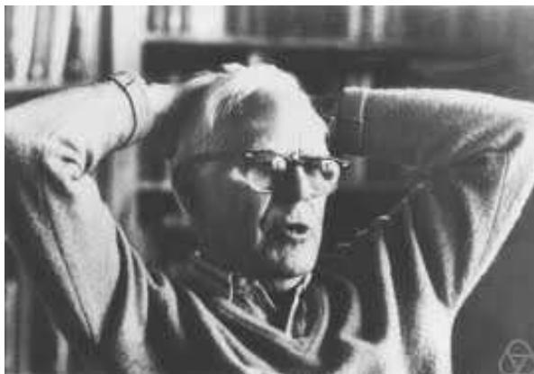
Obr. 1. MARTIN GARDNER