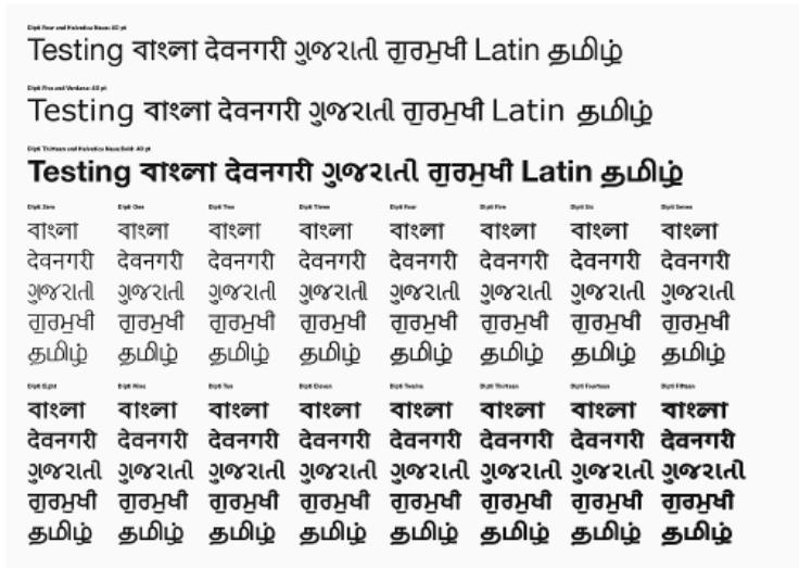
Snímek z přednášky Dana Rhatigana.