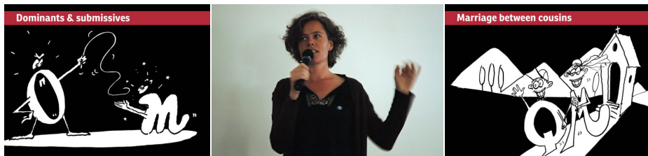
Snímky jsou z přednášky Veroniky Burian.

Když designeři začínají nový projekt, je volba písma jedním z mnoha úkolů, které je čekají. Zásadní je rozpoznání efektu kombinování písem. Některé z důležitých otázek v tomto kontextu jsou tyto: jaký styl typografie přeneše sdělení nejlépe, jaká písma spolu pro daný účel dobře fungují, jaká znaková sada a kolik tučností je potřeba a nakonec jaké funkce očekáváme, že písma budou plnit. Tato prezentace se zabývá právě takovými základními problémy a nabízí návod, jak přistupovat k citlivým vztahům lásky a nenávisťi, které mezi písmy mnohdy existují. Pojednání je ilustrováno ukázkami „typografických párů“, těch dobrých i těch špatných.