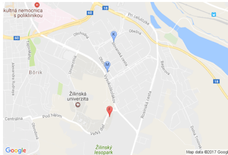
Obrázok 4: Ukážka mapy okolia FRI ŽU (marker F) s vyznačením stravovacích zariadení „Miláno“ (marker M) a „Kazačok“ (marker K)

je mu priradený zoznam všetkých značiek, ktoré majú byť vyznačené na mape. Zoznam markerov sa uzatvára do zložených zátvoriek, pričom každý z nich je definovaný sekvenciou: