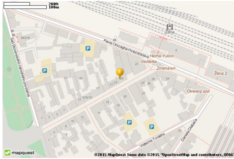
Obrázok 1: Ukážka výstupu získaného pomocou \getmap . Zobrazená je náhodne vybraná adresa v centre mesta Žilina