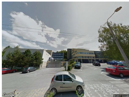
Obrázok 6: Snímka FRI ŽU zo služby Google Street View