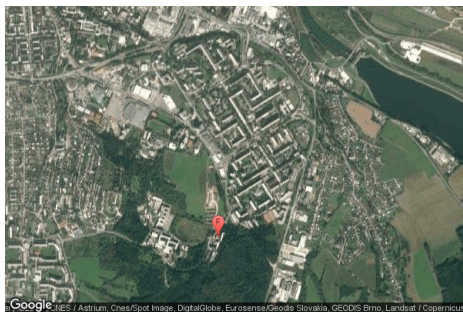
Obrázok 7: Satelitný záber okolia FRI ŽU