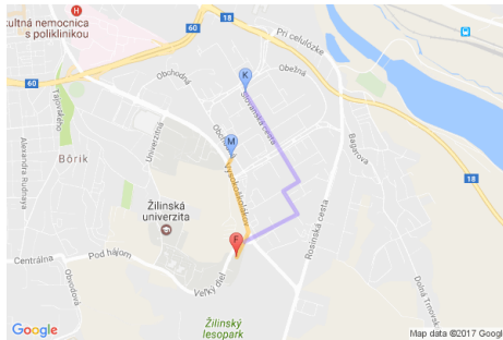
Obrázok 5: Ukážka mapy okolia FRI ŽU (marker F) s vyznačením stravovacích zariadení „Miláno“ (marker M) a „Kazačok“ (marker K) a trasy ku nim