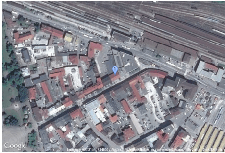
Obrázok 3: Ukážka výstupu rovnakej oblasti ako na obrázku 1, získaného z Google Maps pomocou voľby type=satellite . Zobrazená je rovnaká adresa v centre mesta Žilina