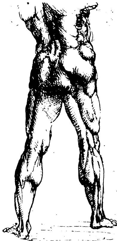
LEONARDO DA VINCI: Studie