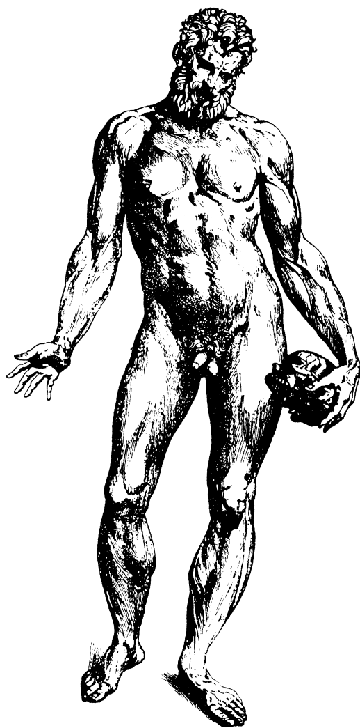
ANDREAS VESALIUS (16. stol.): Postava muže s lebkou