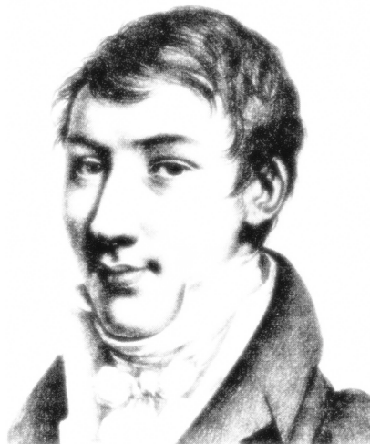
OBR. 6.1 AUGUSTIN–LOUIS CAUCHY