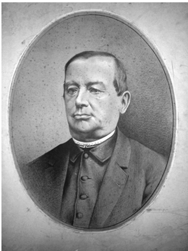
OBR. 4.1 VÁCLAV ŠIMERKA