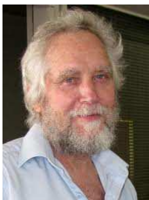
ENDRE SZEMERÉDI

V letošním roce putuje Abelova cena za matematiku do Maďarska k prof. Endre Szemerédimu, který ji dostal za své fundamentální objevy v diskrétní matematice a teoretické informatice a jejich dlouhotrvajícím vlivům na aditivní teorii čísel a ergodickou teorii [20]. Je to již desátá jubilejní Abelova cena od svého vzniku v roce 2003. Dalším maďarským matematikem, který tuto nejprestižnější cenu za matematiku získal v roce 2005, je Peter Lax. Matematika v Maďarsku má totiž dlouholetou tradici. Vzpomeňme několika dalších významných maďarských matematiků světového významu, např. János Bolyai, Lipót Fejér, Marcel Grossmann, Alfréd Haar, András Hajnal, Cornelius Lanczos, László Lovász, John von Neumann, Rózsa Péter, George Pólya, Alfréd Rényi, Marcel Riesz, Pál Turán a jeho manželka Vera T. Sós, Endre Süli, Karl Zsigmondy, a též Pál Erdős, který má v databázi Mathematical Reviews registrováno přes 1 500 vědeckých prací. Jen málo zemí velikosti Maďarska se může podobným seznamem pochlubit.